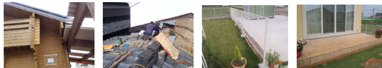
柵設置、エクステリア工事

編集後記 本年も押し詰まてまいりましたが2013年はどのような1年でしたでしょうか。皆様方のおかげで10年の節目、この1年を無事終えることができました。有難く感謝の気持ちでいっぱいです。どうぞ来年も相対らぬご縁の程、お願い申し上げます。 『新年、社長は年男、おとこひん走ります』